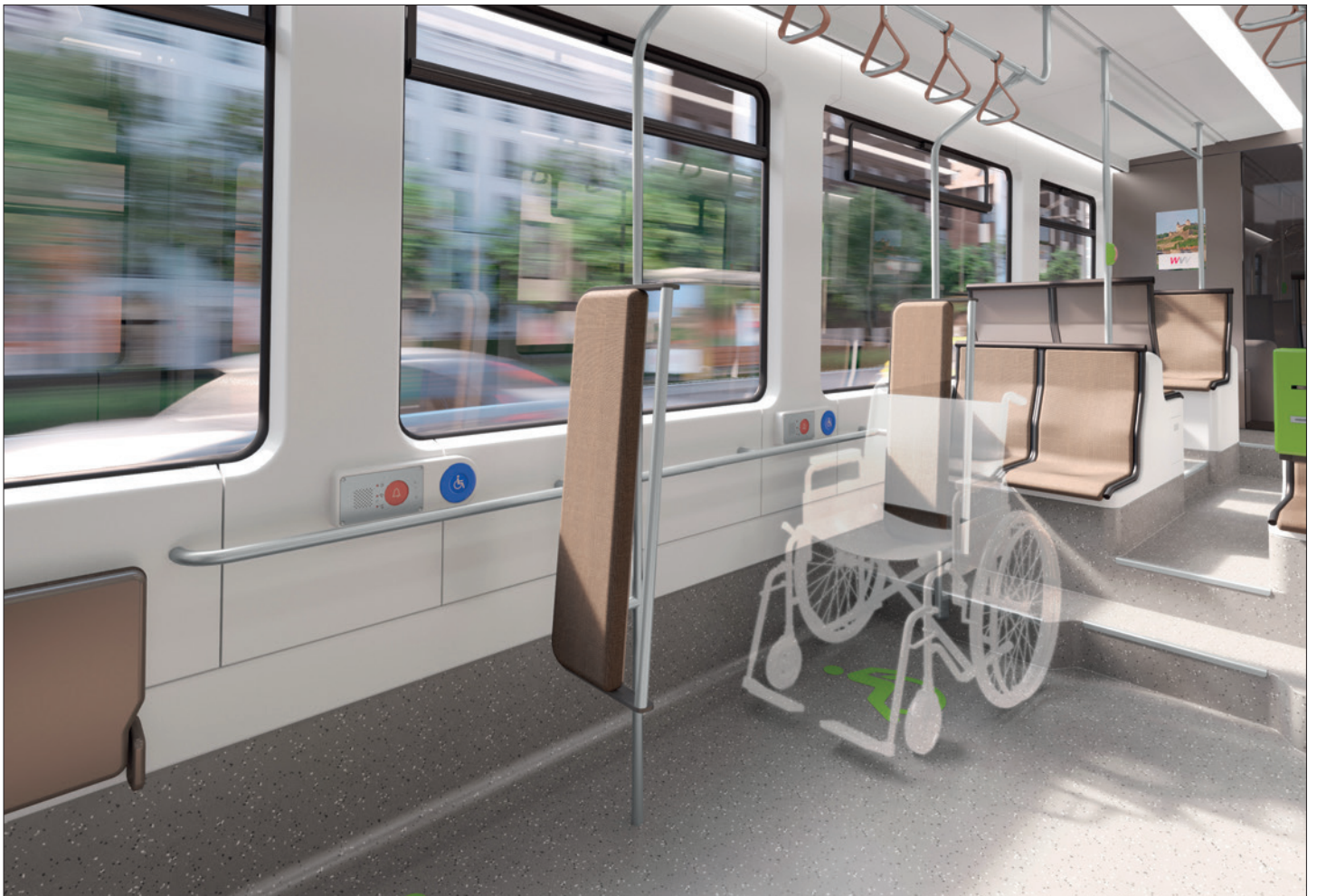
Interieur / Interior GT-F Niederflurbahn für Würzburg