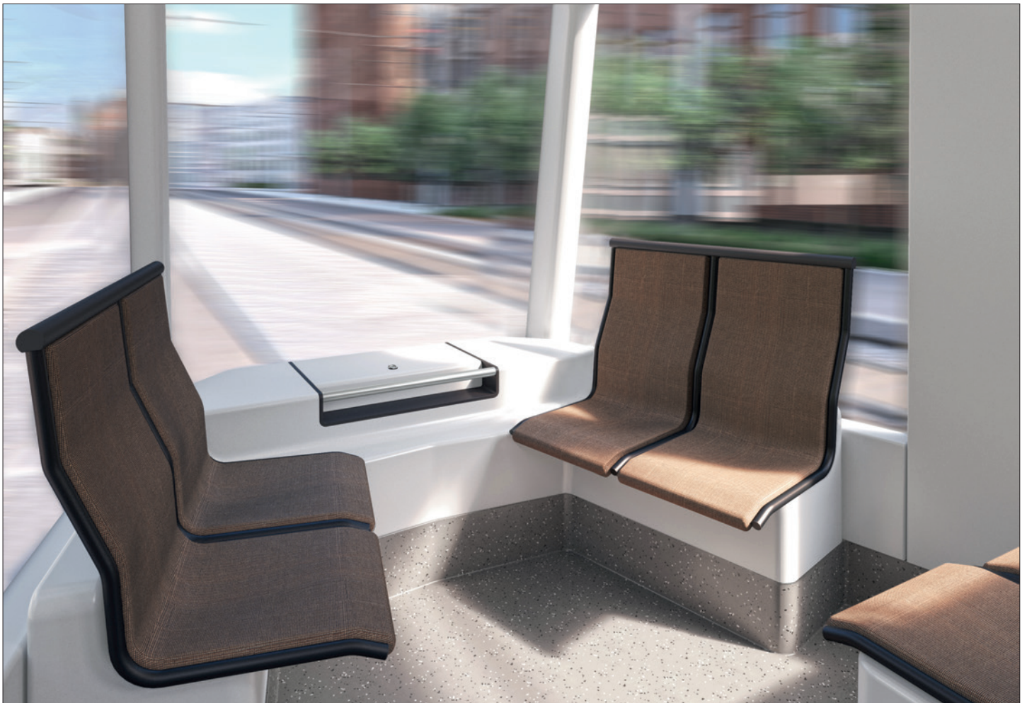
Interieur / Interior GT-F Niederflrbahn für Würzburg