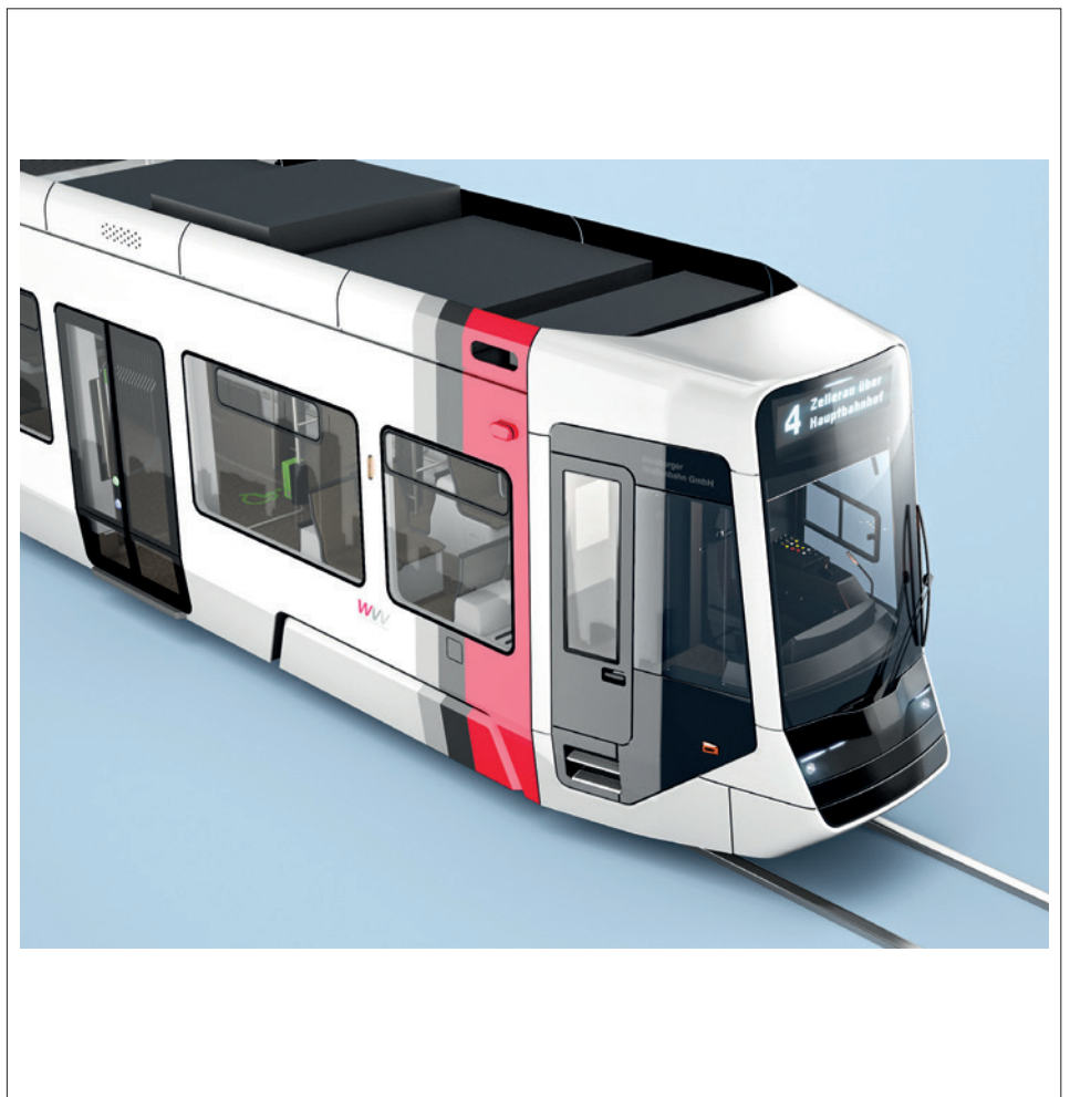
Frontansicht / Front view