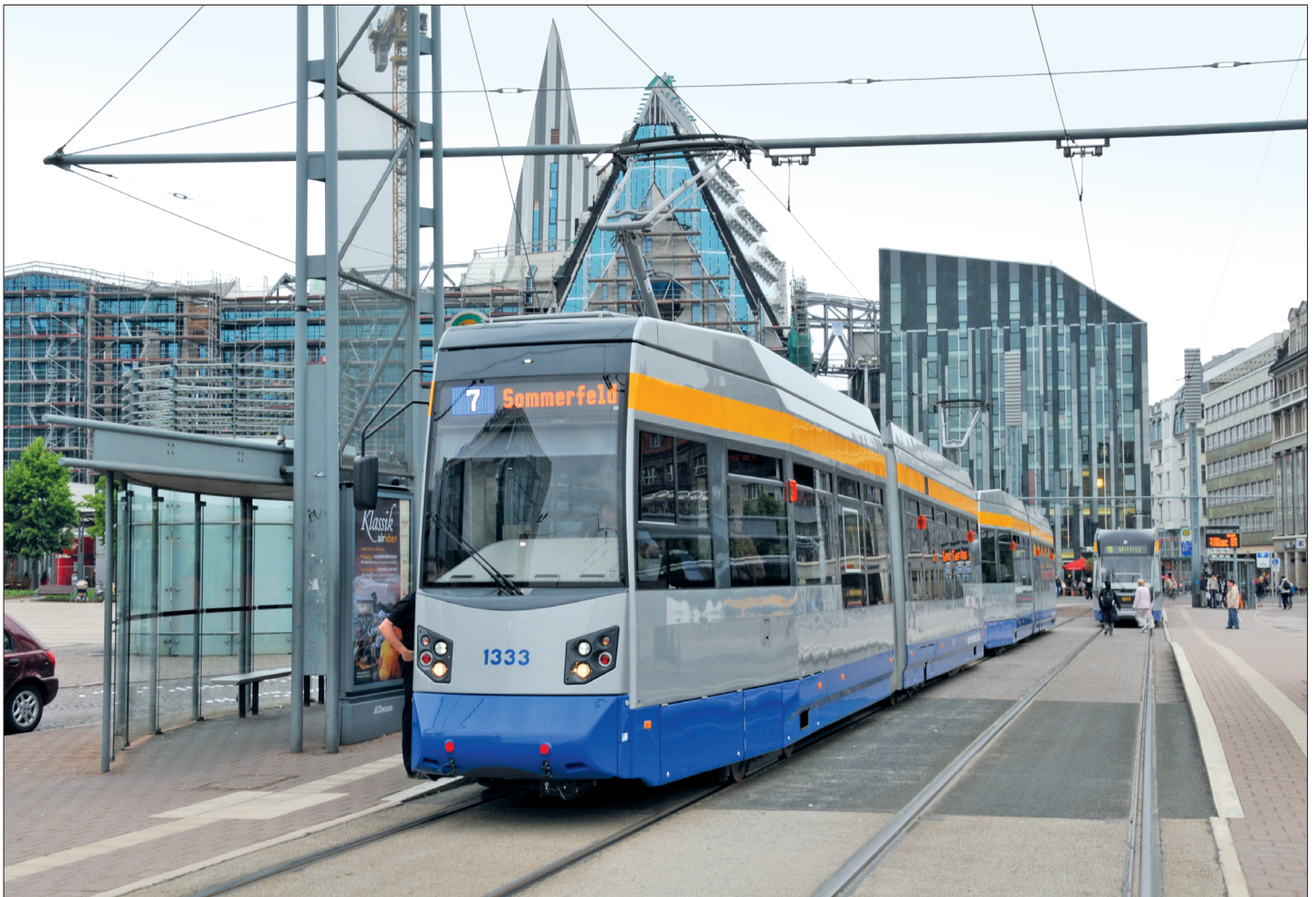
Der LeoLiner fährt in Leipzig und Halberstadt / LeoLiner is operating in cities of Leipzig and Halberstadt, Germany