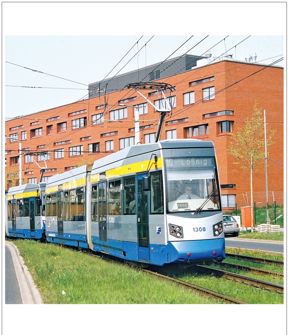
Frontansicht / Front view