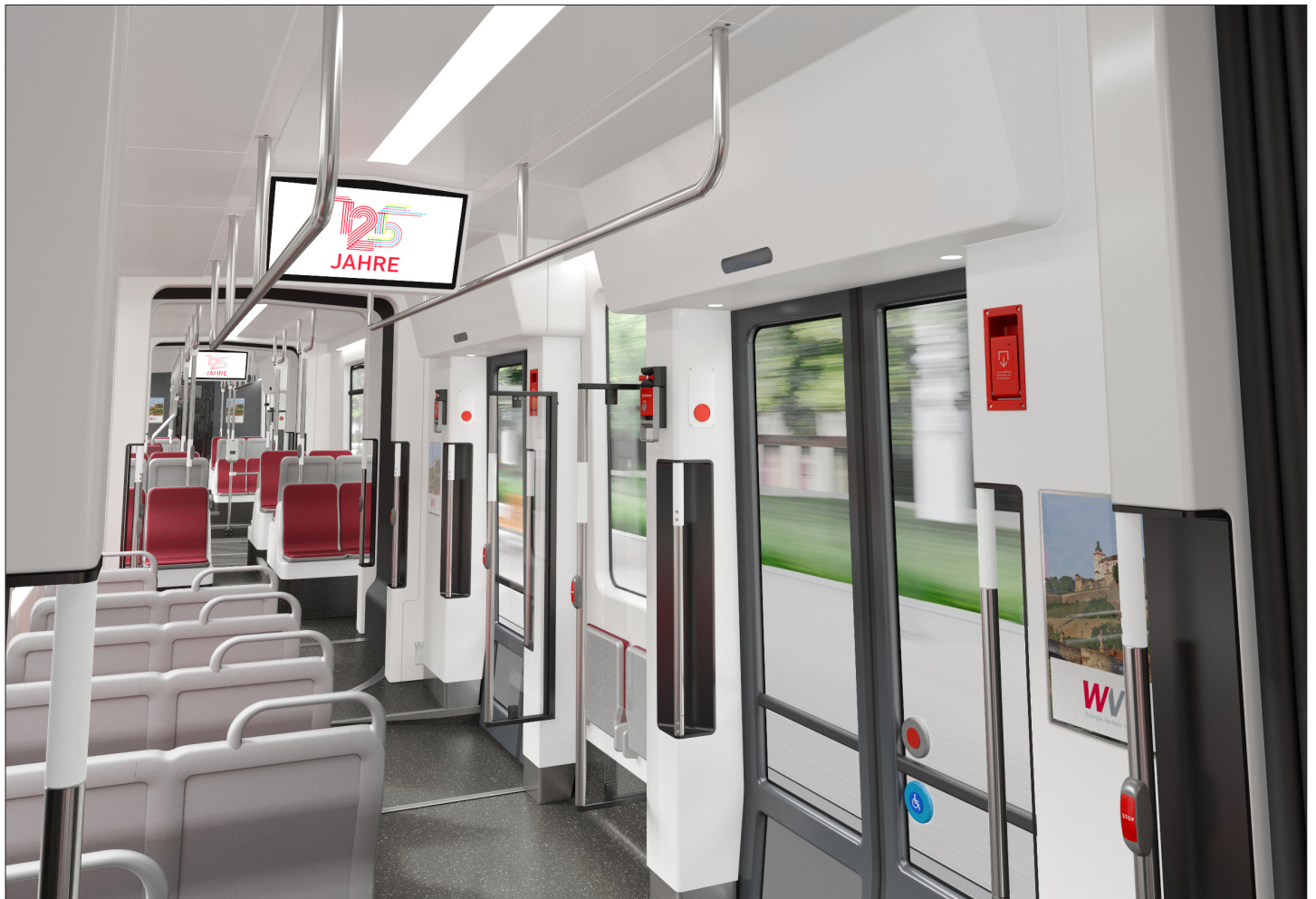
Interieur / Interior GT-F Niederflerbahn für Würzburg