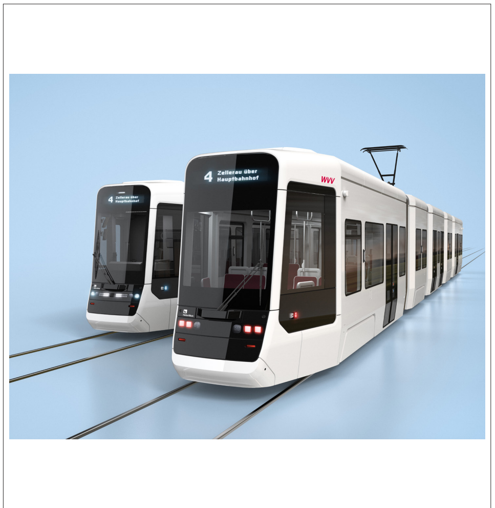
Frontansicht / Front view