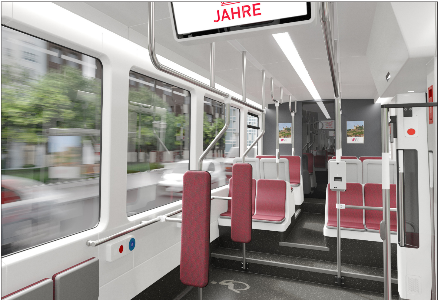
Interieur / Interior GT-F Niederflrbahn für Würzburg